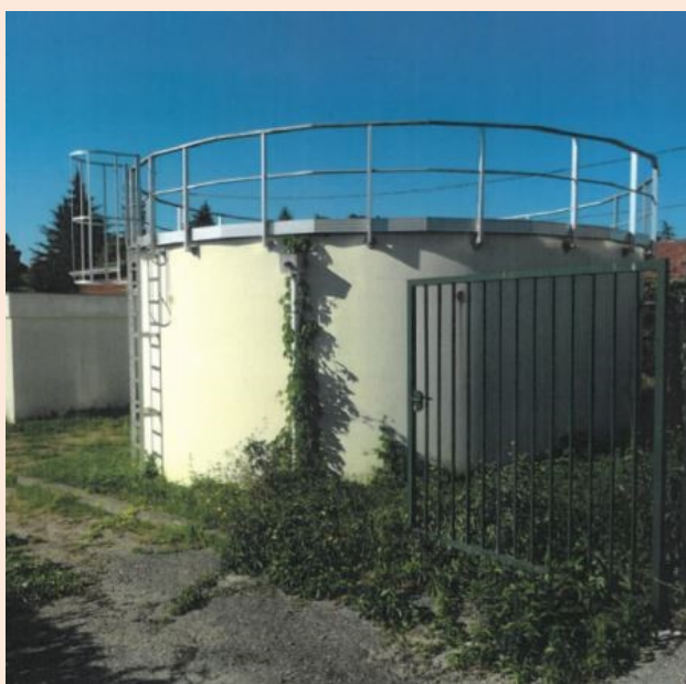
Le réservoir d'eau potable, remplaçant le château d'eau (coteau de Pian)